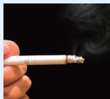
たばこの臭いの消臭に