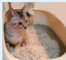
ペットのトイレ周りの消臭に